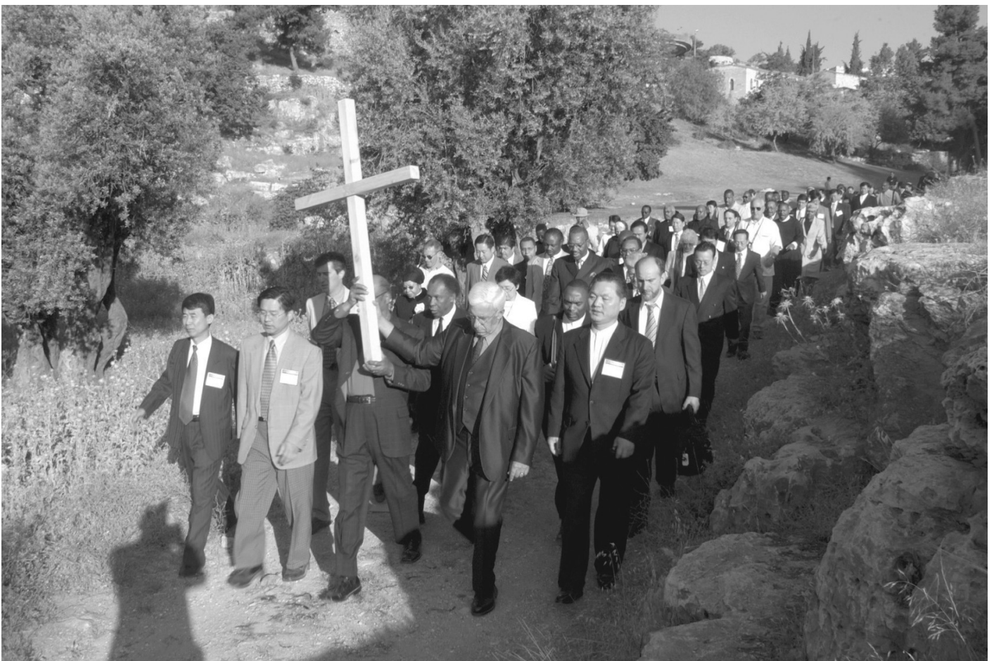
2003 рік: Духовенство та учасники ACLC йдуть до Поля Крові, Єрусалим

На порозі нового тисячоліття Американська конференція лідерів духовенства (ACLC — American Clergy Leadership Conference) вивела наше проповідництво миру на Близькому Сході на новий рівень, виступивши з ініціативою примирення юдеїв і християн. Опираючись на заклик християн обійняти єврейський народ, з'ясувалося, що перешкодою до цієї єдності є хрест. Тому християни закликали «закінчити епоху хреста», знявши хрести і зосередилися на воскресінні та перемозі Ісуса в любові. У травні 2003 року члени християнського духовенства зі США, Європи та Ізраїлю пройшли вулицями Єрусалима з хрестом. Вознісши молитву покаяння і прощення, вони поховали хрест на Полі Крові, яке, за переказами, Юда Іскаріотський купив за 30 срібняків, які отримав за зраду Ісуса. Одна єврейська жінка, яка була присутня на цій події, згодом розповіла, що відчула, немов розвіялися 4000 років смутку її народу.