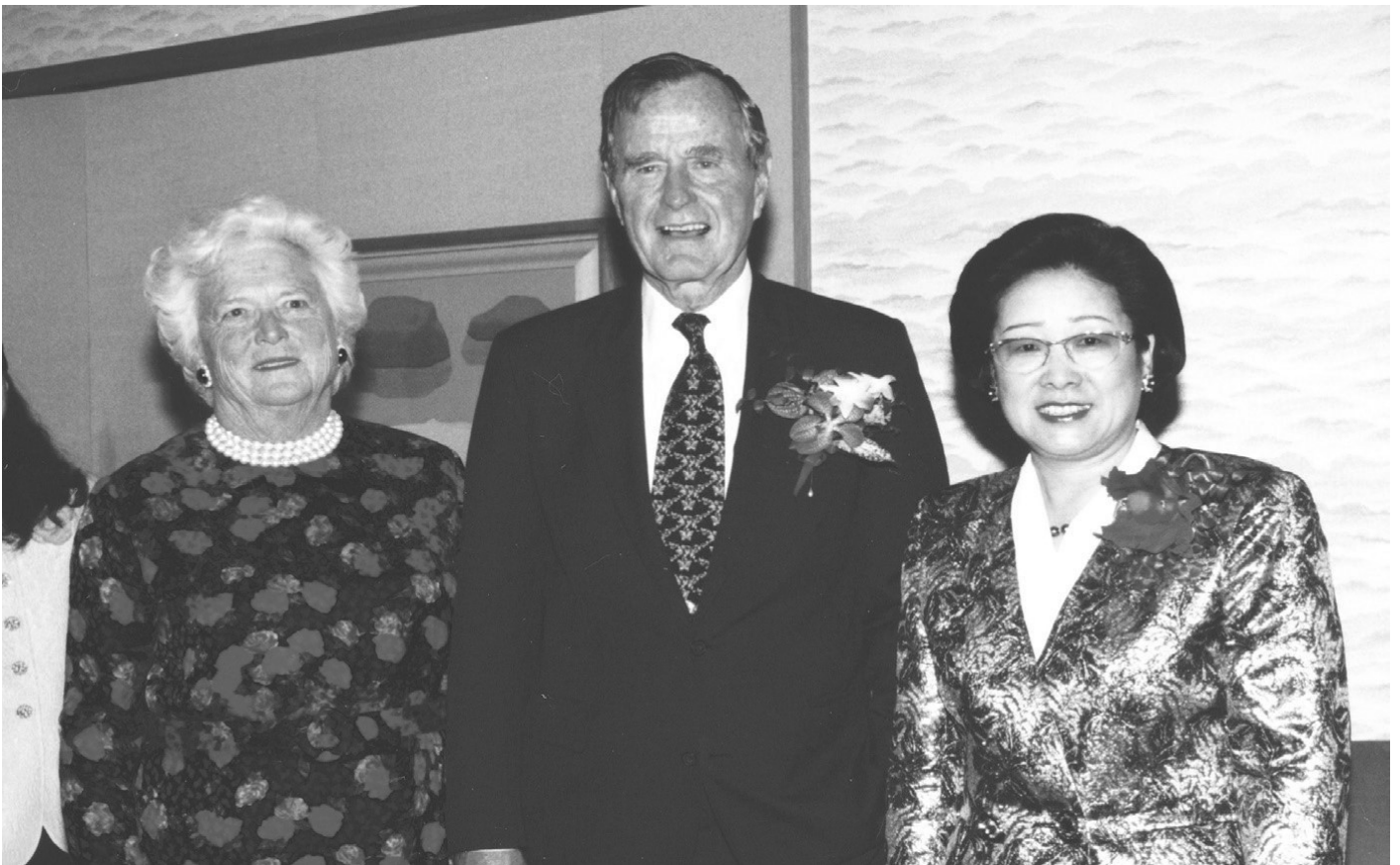
13 вересня 1995 року: Мати Мун із Джорджем і Барбарою Бушами на святкуванні третьої річниці заснування Федерації жінок за мир в усьому світі, Токіо

Жінка повинна виконати місію і дружини, і матері. Обидві місії потрібні для побудови мирного і справедливого світу. Адже мати народжує дітей і покликана виховувати їх у роки їхнього становлення. Це право і відповідальність надаються переважно жінкам.