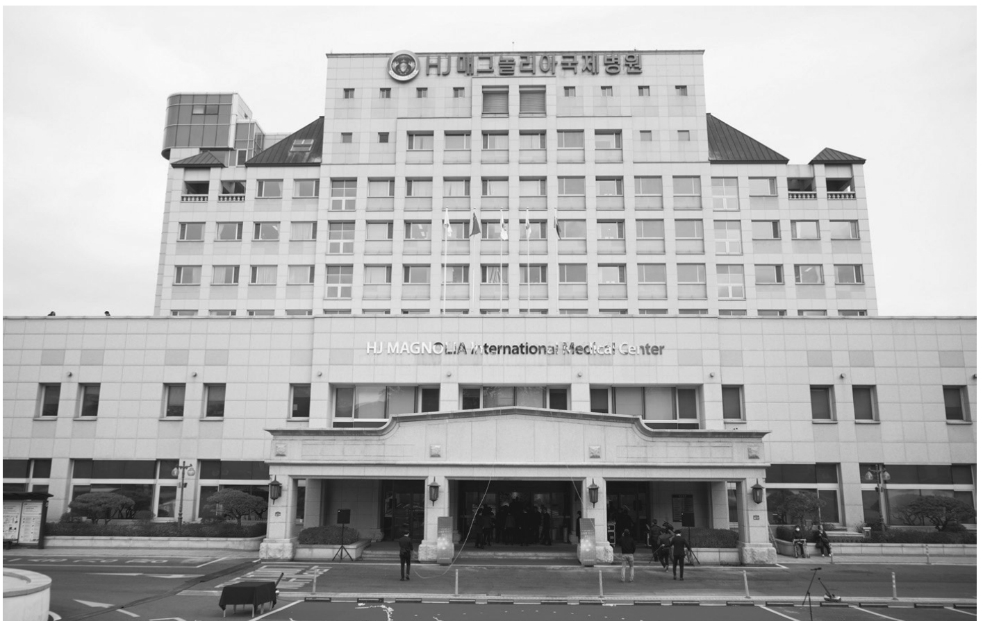
Міжнародний медичний центр «Хьоджон Магнолія», Чонвон, Південна Корея

Глибоко в душі я відчуваю цей біль. Я хочу стати матір'ю, яка зможе обійняти всіх хворих — як фізично, так і духовно. Варто нам лише травмувати палець на нозі, як починає боліти все тіло. Як Мати єдиної родини на чолі з Богом, я відчуваю біль кожної людини, немов власний. Я також хворіла, перебуваючи в інших країнах, тож добре знаю, що означає бути іноземцем, який потребує медичної допомоги.