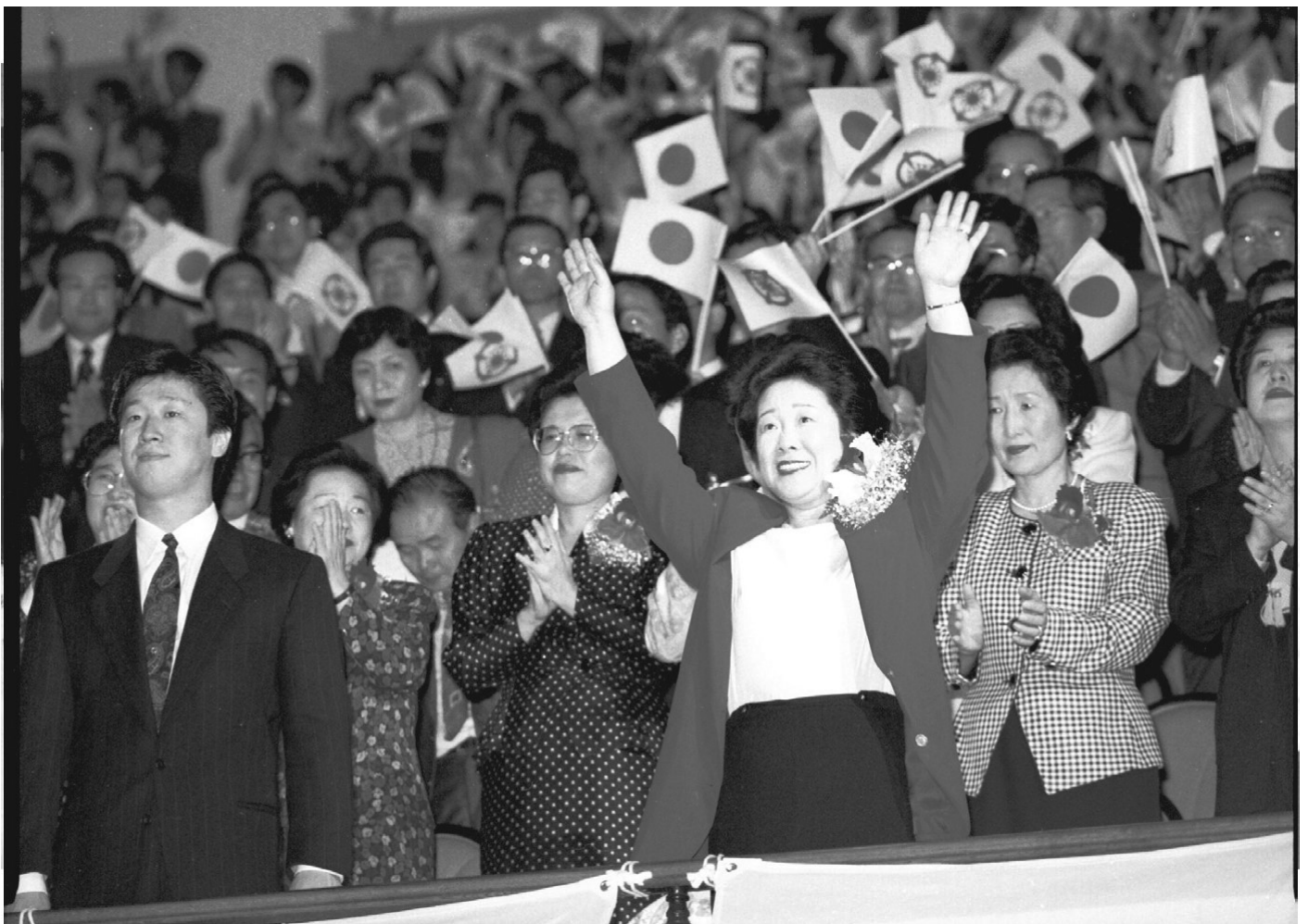
18 вересня 1991 року: Мати Мун на виступі в Японії зі своїм старшим сином Хьо Джином

Керуючись Божим провидінням, ми з чоловіком закликали жінок взяти на себе провідну роль у створенні сімей, які втілять первісний Божий план. Сімей, в яких дружина живе заради свого чоловіка, чоловік — задля своєї дружини, батьки — заради своїх дітей, а діти — задля батьків. Така сім'я по вінця буде наповнена любов'ю, в ній зберуться Божі благословення. Жінкам потрібно йти шляхом істинної матері, дружини і водночас істинної дочки. Жінки наділені чарівною здатністю створювати гармонію і заспокоювати душу. Наречені будують мости. Світ майбутнього може стати світом порозуміння й миру тільки тоді, коли ґрунтуватиметься на материнській любові і жіночій прихильності. В цьому істинна сила жіноцтва. Настала пора, коли світ врятує сила справжньої жіночності.