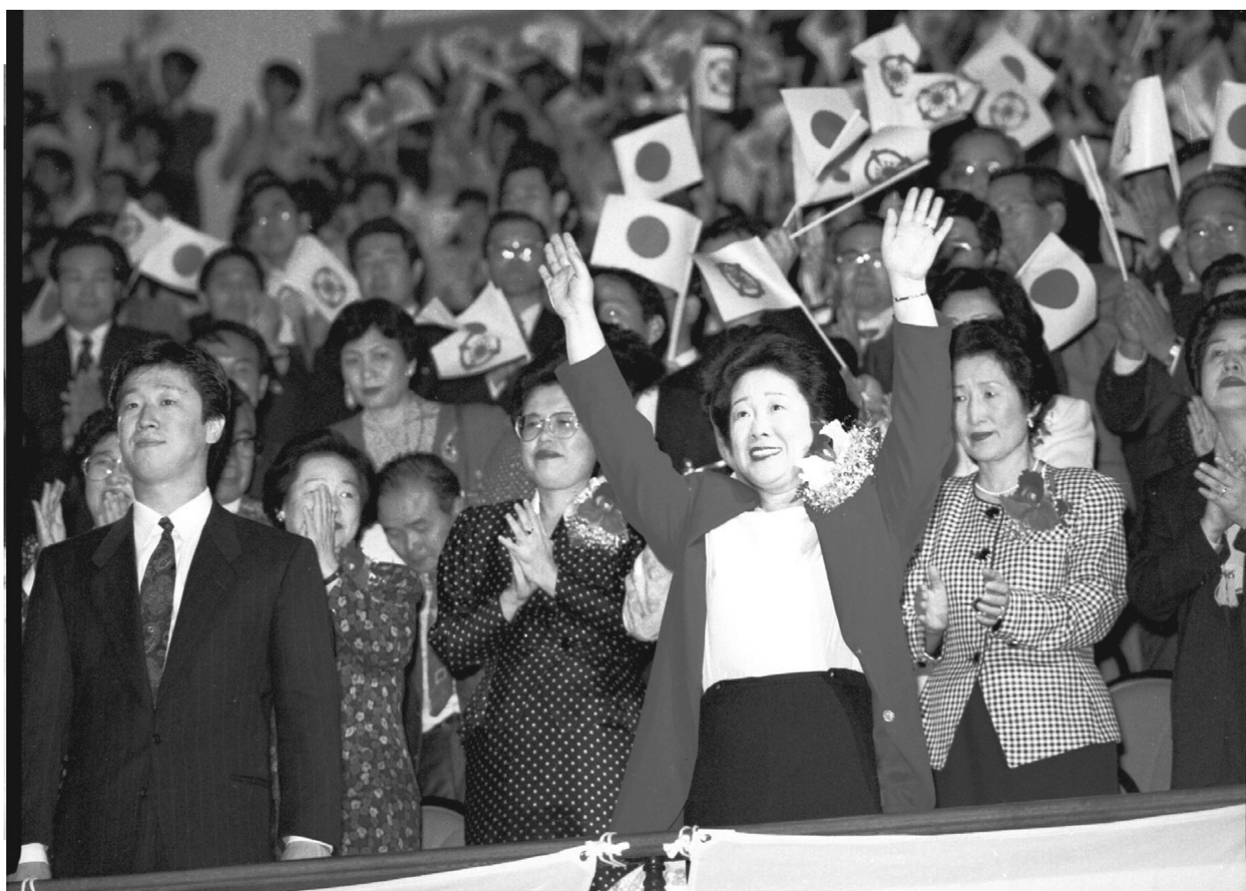
18 вересня 1991 року: Мати Мун на виступі в Японії зі своїм старшим сином Хьо Джином

Керуючись Божим провидінням, ми з чоловіком закликали жінок взяти на себе провідну роль у створенні сімей, які втілять первісний Божий план. Сімей, в яких дружина живе заради свого чоловіка, чоловік — задля своєї дружини, батьки — заради своїх дітей, а діти — задля батьків. Така сім'я по вінець буде наповнена любов'ю, в ній зберуться Божі благословення. Жінкам потрібно йти шляхом істинної матері, дружини і водночас істинної дочки. Жінки наділені чарівною здатністю створювати гармонію і заспокоювати душу. Наречені будують мости. Світ майбутнього може стати світом порозуміння й миру тільки тоді, коли ґрунтуватиметься на материнській любові і жіночій прихильності. В цьому істинна сила жіноцтва. Настала пора, коли світ врятує сила справжньої жіночності.