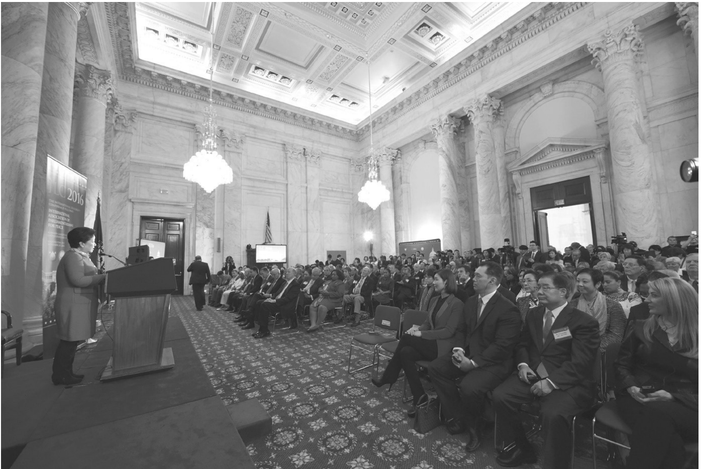
30 грудня 2016 року: заснування Міжнародної асоціації парламентарів за мир, дорадча кімната Кеннеді, Офісна будівля сенату Рассела, Вашингтон, округ Колумбія

Завершальне зібрання ми провели 2016 року у Вашингтоні (округ Колумбія). Важливо було обрати місце проведення конференції IAPP, яка мала стати кульмінацією всіх попередніх зусиль. Урешті члени Сенату Сполучених Штатів запропонували провести подію в дорадчій кімнаті Кеннеді — одному з найпрестижніших історичних приміщень кімнати сенату. Спонсори зі Сенату сказали мені: «Є багато кімнат, доступних для проведення церемонії відкриття. Однак з погляду значущості цієї події для нас ми приготуємо дорадчу кімнату Кеннеді».