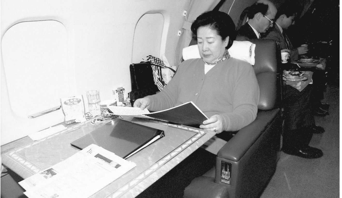
Мати Мун вивчає свою промову під час перельоту між країнами

чергова жіноча організація, це дзеркало, що відображає нову епоху. Того дня моя промова стала дороговказом, який веде людей зі світу воєн, насильства і конфліктів в ідеальний світ єдиної сім'ї людства на чолі з гармонійними чоловіками й жінками, сповненими любові та миру.