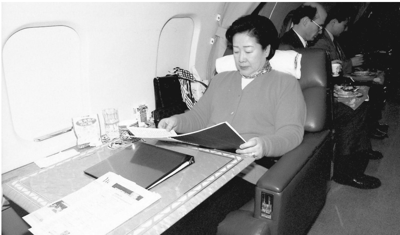
Мати Мун вивчає свою промову під час перельоту між країнами

чергова жіноча організація, це дзеркало, що відображає нову епоху. Того дня моя промова стала дороговказом, який веде людей зі світу воєн, насильства і конфліктів в ідеальний світ єдиної сім'ї людства на чолі з гармонійними чоловіками й жінками, сповненими любові та миру.